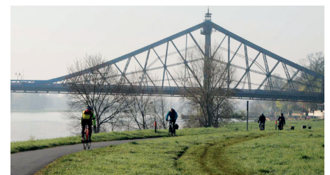
Radfahrer auf dem Elberadweg

Veit Böhm, verkehrspolitischer Sprecher CDU-Fraktion veit.boehm@stadtrat.dresden.de