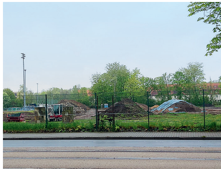
künftiger LEO-Standort in Seidnitz

Als finanzpolitischer Sprecher unserer Fraktion oblag es mir, eine stabile haushaltstragende Mehrheit, immerhin aus 5 Fraktionen des Stadtrates, gemeinsam mit den Kolleginnen und Kollegen zu schmieden. Auch wenn naturgemäß einige Wünsche und Projekte noch keine Berücksichtigung finden konnten, so sei doch beispielhaft erwähnt, dass allein im Schulhausbau jedes Jahr mehr als 100 Mio. € verplant und ver-